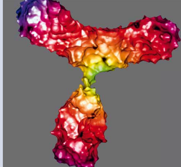
Wirkstoff-Shuttle: Die Computeranimation zeigt die Molekülstruktur des Antikörpers. daran gekoppelt wird der Wirkstoff vom Immunsystem unerkannt direkt zur Krebszelle transportiert.

So künstlich der Produktionsprozess der Immunokonjugate erscheint, so natürlich ist deren Hauptkomponente: Antikörper sind ein sehr wichtiger Bestandteil der menschlichen Immunabwehr. Der Körper investiert sehr viel Energie in die Produktion dieser Y-förmigen Eiweißmoleküle. An den zwei kurzen Armen binden sie ihr Zielmolekül, das sogenannte Antigen. Dabei sind sie sehr wählerisch: Oft sind es nur Kleinigkeiten – einzelne Windungen oder Ladungen im Molekül –, die nach dem ersten Kontakt doch nicht in die enge Bindungstasche passen. Doch wenn sich ein Molekül schließlich in die Arme eines Antikörpers begibt, bleibt es dort fest gebunden und lässt sich nur noch schwer lösen. Die genaue Form der Bindestellen variiert von Antikörper zu Antikörper. Dafür kombinieren bestimmte Zellen des menschlichen Immunsystems, die B-Lymphozyten, per Zufall etwa 170 Gene auf unterschiedlichen Chromosomen miteinander. Durch dieses Puzzlespiel in Kombination mit weiteren Molekülmodifikationen entstehen bis zu 10^{11} unterschiedliche Antikörper-Gerüste – eine schier unendliche Zahl an Strukturen, die eindringende Fremdlinge wie Bakterien oder Viren im Körper rechtzeitig binden und erkennen sollen – als eine Art Gesundheitspolizei.