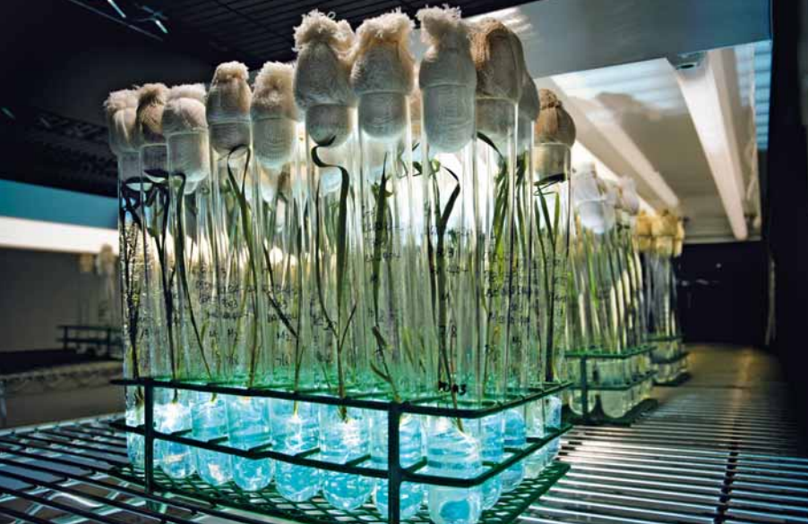
Stresstest: Im Innovationszentrum in Gent testet Dr. Alain Sailland (Foto li.) neue, ertragreiche Sorten des Getreides. Dazu werden extreme Umgebungsbedingungen (o.) simuliert und so im Labor geprüft, wie sich Ertragsstärke und Stresstoleranz des Getreides erhöhen lassen.

Mitarbeiter genetisch verschiedene Eltern-Sorten und züchten hinterher per MAS jene Sorte heraus, die möglichst viele positive Eigenschaften vereint. Die erste Reis-Sorte aus der smart-breeding-Werkstatt kam 2008 auf den Markt: Arize™ Dhani ist resistent gegen den Bakterienbrand, eine verheerende Infektion, die ganze Ernten vernichten kann. Sie ist speziell auf die indischen Wetterverhältnisse abgestimmt. Derzeit entwickeln die Forscher aus Gent neue Varianten, die an andere Umweltbedingungen und Erregertypen angepasst sind, um weitere Märkte zu erschließen.