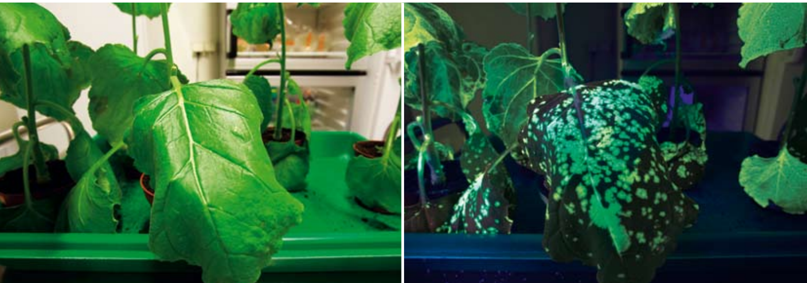
Kontroll-Leuchten: Unter ultraviolettem Licht (r.) offenbaren Tabakpflanzen, dass die Bayer-Forscher mit dem Tauchbad-Verfahren (s. S. 41) erfolgreich die DNS für ein Leuchtprotein in ihre Blätter bringen konnten. Das grün fluoreszierende Protein (GFP) dient als Test für spätere Wirkstoffproteine. Mit dem Tauchbad-Verfahren können schnell große Proteinmengen geerntet werden. Nach einiger Zeit verlieren die Tabakpflanzen das neue Gen wieder.

weiße zusammenzubauen und richtig zu falten. Die Folge: Bei komplizierten Proteinstrukturen versagt das Verfahren, das Ergebnis sind nur unbrauchbare Eiweißklümpchen.